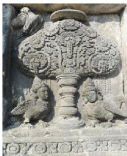
Koleksi: Muhamad Idris

Gambar Cover: Pohon Kalpataru Candi Prambanan