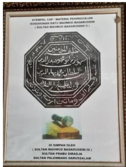
Gambar 8. Cap Stempel/Materai Peninggalan Sultan Mahmud Badaruddin II (Sumber: Observasi 12 September 2021)