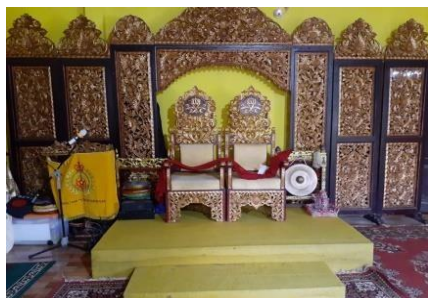
Gambar 6. Singgasana Sultan

Selain pendopo, ruang tamu, dan Balai Sri yang menjadi bagian utama dari Istana Adat Kesultanan Palembang Darussalam, pada bagian belakang dari tiga bagian utama ini merupakan tempat tinggal sultan beserta keluarga. Selain itu terdapat satu ruangan lagi di lantai satu tepatnya dibagian bawah Balai Sri yang sedang direncanakan untuk dibangun perpustakaan dan galeri Kesultanan Palembang Darussalam. Selain itu, terdapat pula gambar-gambar dan lukisan yang di pajang di beberapa sudut Istana Adat Kesultanan Palembang Darussalam diantaranya adalah sebagai berikut.