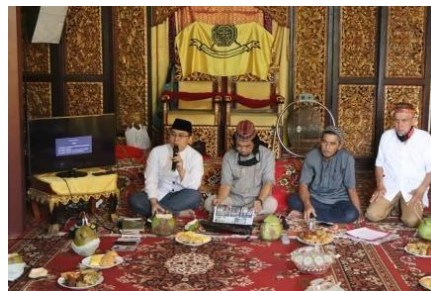
Gambar 13. Kegiatan Kajian 25 September 2020

Istana Adat Kesultanan Palembang Darussalam dalam upayanya menjadi wadah pelestarian adat budaya Palembang melakukan beberapa kegiatan di antaranya adalah menggelar diskusi-diskusi mengenai adat budaya Palembang. Berdasarkan hasil wawancara dengan Sultan Mahmud Badaruddin (SMB) IV Jayo Wikramo R.M. Fauwaz Dirajda, S.H., M.Kn. beliau mengatakan bahwa dalam usaha pelestarian adat budaya Palembang, Istana Adat Kesultanan Palembang Darussalam rutin melakukan kajian-kajian dan diskusi-diskusi. Kegiatan diskusi yang dilakukan salah satunya dilaksanakan pada Jumat, 25 September 2020 dimana pada kegiatan diskusi ini membahas mengenai gelar-gelar kebangsawanan Palembang.