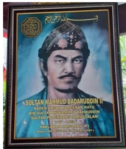
Gambar 7. Sultan Mahmud Badaruddin II

Selain pendopo, ruang tamu, dan Balai Sri yang menjadi bagian utama dari Istana Adat Kesultanan Palembang Darussalam, pada bagian belakang dari tiga bagian utama ini merupakan tempat tinggal sultan beserta keluarga. Selain itu terdapat satu ruangan lagi di lantai satu tepatnya dibagian bawah Balai Sri yang sedang direncanakan untuk dibangun perpustakaan dan galeri Kesultanan Palembang Darussalam. Selain itu, terdapat pula gambar-gambar dan lukisan yang di pajang di beberapa sudut Istana Adat Kesultanan Palembang Darussalam diantaranya adalah sebagai berikut.