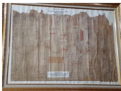
Gambar 11. Naskah Asli Denah Tempat Tinggal/Perkampungan Susuhunan Ratu Mahmud Badaruddin (SMB II) Selama dalam Pengasingan di Ternate