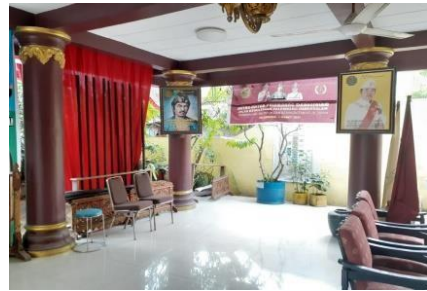
Gambar 3. Pendopo Istana Adat

Kesultanan Palembang Darussalam terdiri dari beberapa bagian yaitu terdapat pendopo dibagian depan Istana yang berfungsi sebagai tempat berkumpul dan diadakannya beragam kegiatan-kegiatan. Pendopo ini berada di ruangan terbuka dengan ukurannya yang cukup luas sehingga kegiatan-kegiatan yang dilakukan di pendopo ini biasanya merupakan kegiatan yang diikuti oleh massa yang cukup banyak.