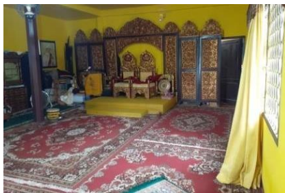
Gambar 5. Balai Sri