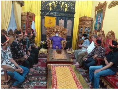
Gambar 14. Kunjungan 24 Januari 2021