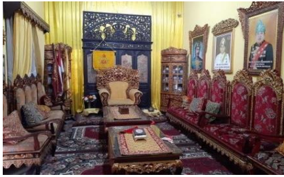
Gambar 4. Ruang Tamu (Sumber: Observasi 12 September 2021)