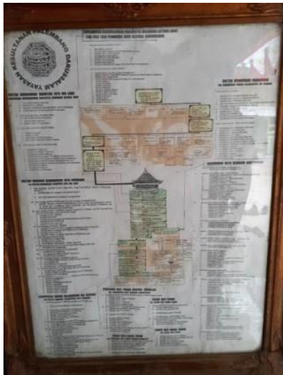
Gambar 10. Denah Tempat Tinggal/Perkampungan Susuhunan Ratu Mahmud Badaruddin (SMB II) Selama dalam Pengasingan di Ternate