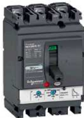
Gambar 4. Contoh sebuah MCCB

Untuk MCCB dengan kapasitas tetap, maka MCCB tersebut akan bekerja hanya pada kapasitas yang tertera pada nameplate MCCB tersebut, sedangkan untuk MCCB dengan kapasitas bervariasi, maka kapasitas kerja MCCB dapat di setting sesuai dengan nilai antara yang tertera pada nameplate MCCB tersebut.