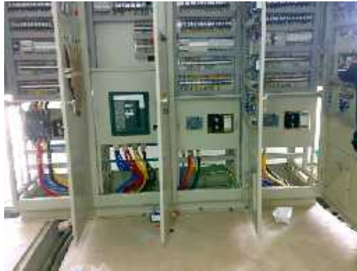
Gambar 3. Komponen di dalam panel LVMDP

Dari Gambar 1, suatu wiring sistem kelistrikan panel LVMDP, komponen utama yang harus dapat memikul bebannya adalah MCCB utama, kemudian busbar, dan MCCB cabang. MCCB cabang harus dapat memikul setiap beban yang terdapat pada cabang pelayanannya (feeder). Sedangkan MCCB utama harus mampu memikul seluruh beban pada sistem kelistrikan yang dilayaninya.