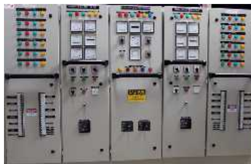
Gambar 2. Komponen di luar panel LVMDP