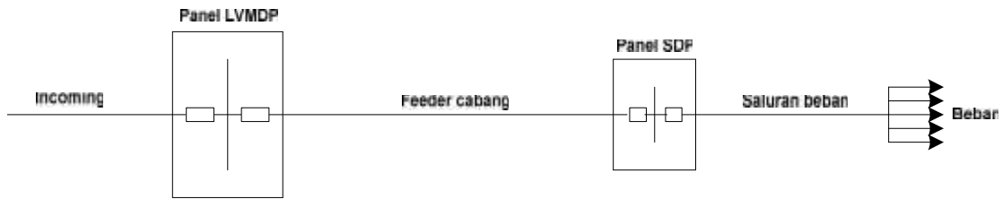
Gambar 5. Diagram satu garis setiap feeder.