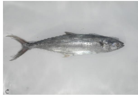
b. Citra 6 jam pertama