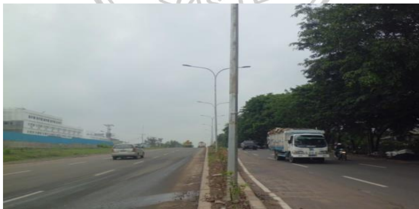
Gambar 1. Keadaan Jalan Soekarno Hatta