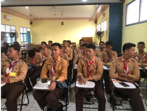
Gambar 4. Dokumentasi Kegiatan Sosialisasi di SMK Bina Jaya Palembang

Terkait kejelasan tujuan sosialisasi, sekitar 85 orang (85%) menyatakan tujuan sangat jelas dan 15 orang (15%) menyatakan jelas. Kemudian mengenai fasilitas sosialisasi, sebanyak 92 orang (92%) menyatakan fasilitas sangat baik dan 8 orang (8%) menyatakan baik. Lalu mengenai pemahaman tentang materi sosialisasi, maka sekitar 95 orang (95%) menyatakan sangat paham dan 5 orang (5%) menyatakan paham.