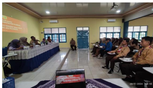
Gambar 2. Dokumentasi Kegiatan Sosialisasi di SMK Bina Jaya

Sedangkan kelompok kedua dengan ruang yang berbeda dengan beberapa dosen yang berbeda melakukan sosialisasi dengan audio visual berupa tayangan video. Dan selanjutnya para peserta PkM (peserta didik) bertukar ruangan, sehingga mereka mendapatkan materi yang sama.