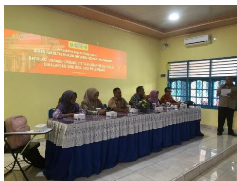
Gambar 1. Dokumentasi Kegiatan Sosialisasi di SMK Bina Jaya Palembang

Kelompok pertama dengan beberapa dosen melakukan sosialisasi dalam bentuk ceramah dan penjelasan dengan slide powerpoint.