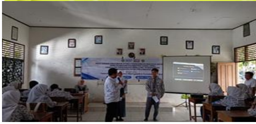
Gambar 3. Praktik

Pelatihan kecakapan komunikasi verbal dalam situasi publik berlangsung lancar tanpa berhadapan dengan hambatan yang signifikan. Semua tahapan program berhasil diselesaikan. Peserta terlibat dan reseptif dalam setiap sesi. Pada bagian praktik, para siswa antusias dengan kesempatan untuk memperkenalkan diri mereka. Mereka yang berkesempatan berbicara masing-masing memiliki waktu 10 menit untuk presentasinya. Hasil evaluasi berdasarkan reaksi siswa selama pelatihan dan sesi tanya jawab sangat positif dan memuaskan.