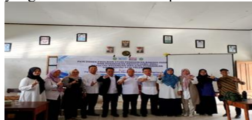
Gambar 1. Foto Bersama Dosen

efektif. Salah satu manfaat utama adalah kemampuan untuk menyampaikan gagasan dan pemikiran kepada publik dengan cara yang jelas dan tegas, mengoptimalkan energi dan waktu yang didedikasikan untuk interaksi ini. Mengembangkan keterampilan berbicara di depan umum—termasuk presentasi, pidato, memotivasi pendengar, dan mengajar—tidak diragukan lagi merupakan keterampilan berharga yang harus dikembangkan setiap orang dalam profesi masing-masing. (Fitria, 2022). Bukti kegiatan: Di bawah ini, kami menyajikan foto-foto yang diambil selama sesi pelatihan.