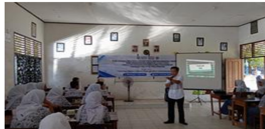
Gambar 2. Kegiatan