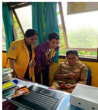
Gambar 3. Proses pembuatan aplikasi canva melalui aplikasi smartphone oleh peserta pengabdian