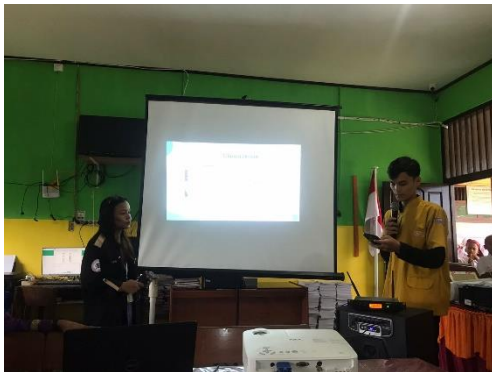
Gambar 1. Pengenalan diri 1 dan penyampain materi

Pelaksanaan pengabdian masyarakat hari pertama adalah pemberian materi dan praktik aplikasi canva dengan dengan menggunakan PC atau smartphone. Praktek membuat canva, Berikut langkah-langkahnya sebagai Berikut.