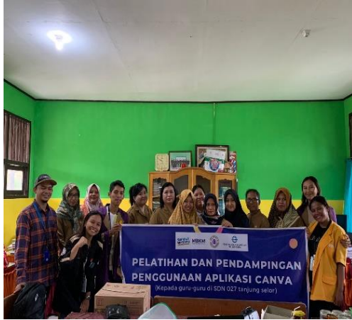
Gambar 4. foto Bersama

Bagian penutup kegiatan pengabdian ini berupa pemberian kenang-kenangan untuk guru,