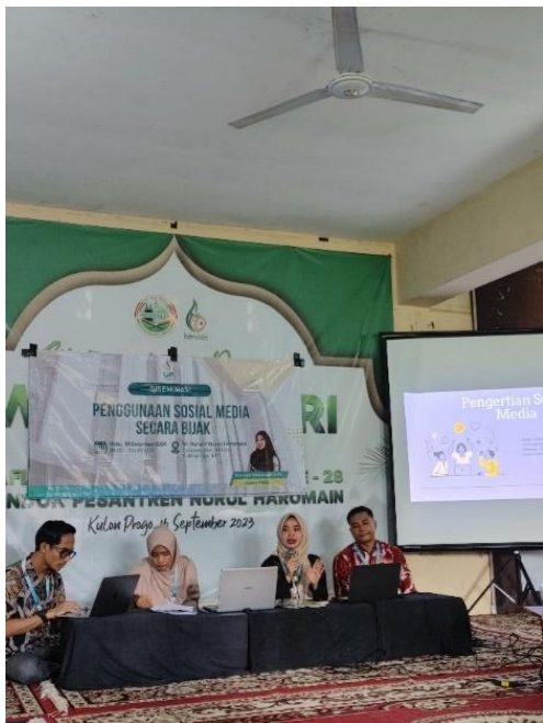
Gambar 3.1 Kegiatan PKM

penting terhadap siswa dan juga keberlangsungan proses pembelajaran di kelas. Dengan adanya kegiatan diseminasi ini diharapkan guru mampu menggunakan dan mengeksplorasi sosial media untuk menjadi media yang dapat membantu dalam proses pembelajaran serta mampu berperan membantu siswa dalam bijak bersosial media.