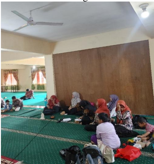
Gambar 3.2 Peserta Kegiatan