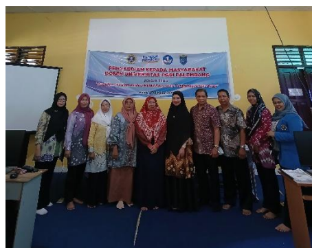
Gambar 2. Foto bersama Peserta (Guru)