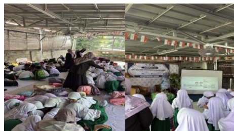
Gambar 1. Pelaksanaan layanan informasi: pencegahan perundungan ( bullying ) di sekolah dengan media puzzle

solusi dari tim pengabdian masyarakat. Layanan ini merupakan salah satu upaya untuk mencegah perundungan ( bullying ) dengan memberikan dukungan informasi yang tepat. Kegiatan ini bertujuan untuk meningkatkan kesadaran peserta didik tentang mencegah perilaku bullying yang terjadi di sekolah melalui edukasi dan layanan informasi yang konferensif serta menggunakan media puzzle. Melalui kegiatan ini harapannya dapat memberikan pemahaman kepada peserta didik tentang dampak negatif perundungan, baik secara psikologis, sosial maupun belajar. Selain itu, tim pengabdian masyarakat juga memberikan solusi praktis dan dukungan informasi untuk mencegah terjadinya perundungan ( bullying ) di sekolah.