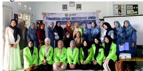
Gambar 1 Audien Pengabdian Masyarakat di PAUD An Nuur Sukabumi.

Refleksi kegiatan dilakukan melalui diskusi terbuka dan penulisan komitmen bersama yang dirumuskan oleh guru dan orang tua. Peserta diminta mengidentifikasi perubahan yang akan dilakukan setelah mengikuti kegiatan serta menyusun langkah konkret untuk memperkuat sinergi. Melalui refleksi ini, diharapkan terbangun komitmen berkelanjutan dalam membentuk karakter anak usia dini secara holistik di PAUD An-Nuur Sukabumi. Foto kegiatan