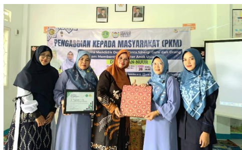
Gambar 2. Di akhir Refleksi audien yang mampu menjawab pertanyaan diberi Reward.