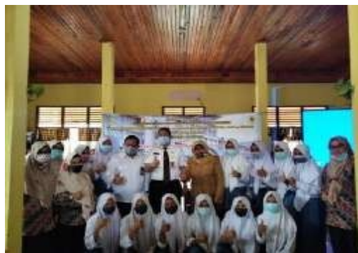
Gambar 3. Foto Bersama Siswa