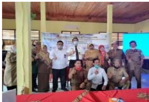
Gambar 4. Foto Bersama Dewan Guru