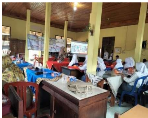
Gambar 2. Sesi Tanya Jawab Siswa

berkenaan dengan koperasi sekolah, cukup besar animo atau tanggapan dari beberapa tanggapan yang disampaikan