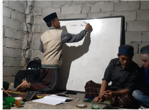
Gambar 1. Kegiatan Bimtek dan FGD

produktivitas hasil pertanian yang lain.