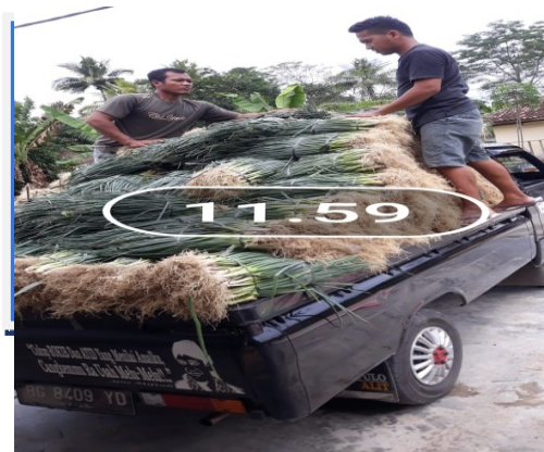
Gambar 2. Hasil Produksi Daun Bawang