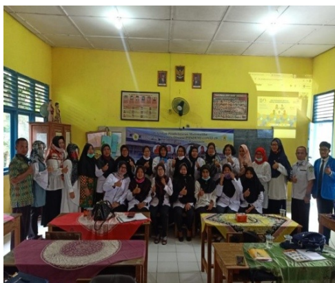
Gambar 2. Pemateri dan Peserta Pelatihan

Berdasarkan analisis angket respon yang disebarkan kepada 30 peserta pelatihan setelah selesai melakukan pelatihan diperoleh hasil sebagai berikut : 83,86 % memberikan respon sangat baik terhadap materi pelatihan, dengan butir-butir instrumen materi pelatihan : sesuai dengan kebutuhan peserta, materi pelatihan dapat diterima dan diterapkan dengan mudah, materi pelatihan disampaikan dengan urut dan sistematikanya jelas, tulisan di dalam materi pelatihan jelas dan mudah dibaca serta kualitas materi pelatihan dapat menambah tingkat keterampilan dan pengetahuan anda.