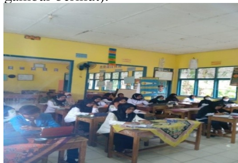
Gambar 1. Suasana Pelatihan dan Pengisian Angket

Kecamatan Babat Supat Kabupaten Musi Banyuasin (dapat dilihat pada gambar berikut).