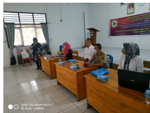
Gambar 2. Dokumentasi Kegiatan Sosialisasi di SMA N 11 Muaraenim

sekitar 15 (75%) menyatakan bahwa kegiatan sosialisasi sangat relevan bagi mereka sedangkan sekitar 4 orang (20%) menyatakan relevan dan sekitar 1 orang (5%) menyatakan cukup relevan. Terkait dengan isi sosialisasi, sekitar 20 orang (100%) menyatakan sangat baik. Mengenai bahan sosialisasi sekitar 17 orang (85%) menyatakan sangat baik, 3 orang (15%) menyatakan baik. Mengenai narasumber yang memberikan sosialisasi, sekitar 16 orang (80%) menyatakan narasumber telah sangat baik menyampaikan, 4 orang (20%) menyatakan baik. Sedangkan mengenai kegiatan secara umum, sekitar 18 orang (90%) menyatakan kegiatan telah berjalan sangat baik dan 2 orang (10%) menyatakan berjalan baik.