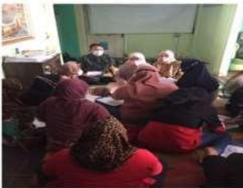
Gambar 3. Penyampaian Isi Materi Oleh Pemateri