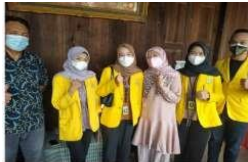
Gambar 6. Bersama mahasiswa yang terlibat dalam pengabdian