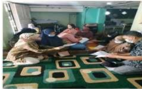
Gambar 4. Tim berdiskusi dengan peserta