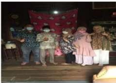
Gambar 2. Sambutan dari Kepala Desa Kerinjing