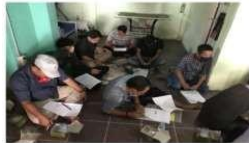
Gambar 5. Para Peserta Menyimak Isi Materi