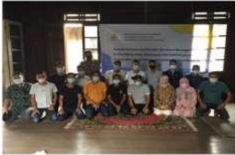
Gambar 1. Tim pengabdian bersama peserta pada saat pembukaan

tanah dan bangunan (BPHTB) bagi masyarakat di desa kerinjing.