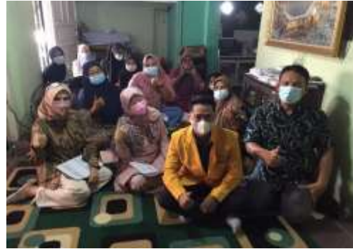
Gambar 6. Bersama mahasiswa yang terlibat dalam pengabdian