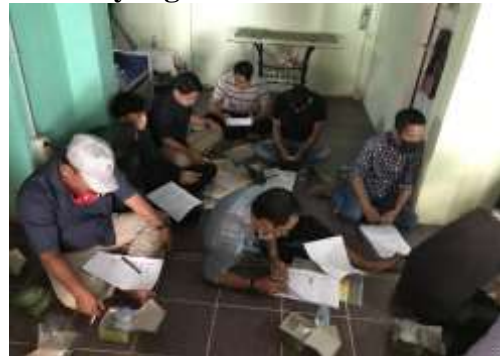
Gambar 7. Peserta mengerjakan latihan yang diberikan tim