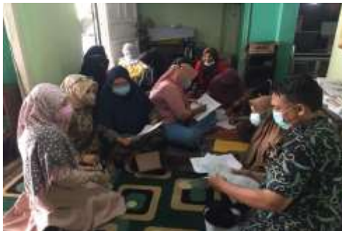
Gambar 4. Tim berdiskusi dengan peserta