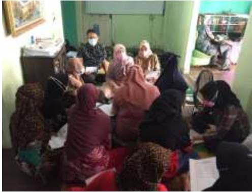
Gambar 3. Tim Pengabdian sedang mempresentasikan materi