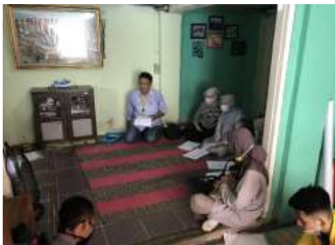
Gambar 5. Para Peserta Menyimak Isi Materi