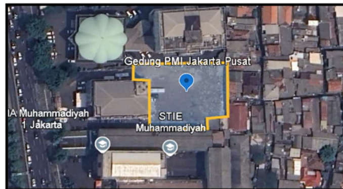
Gambar 1. Lokasi Proyek

Penelitian ini dilaksanakan di proyek pembangunan Gedung B PMI yang terletak di Jl. Kramat Raya No. 47, Kel. Kramat, Kec. Senen, Kota Jakarta Pusat, DKI Jakarta 10450. Pembangunan konstruksi gedung PMI Jakarta mencakup pekerjaan rehabilitasi gedung A 5 lantai dan pembangunan baru gedung B 10 lantai dengan luas 10.274 m 2 yang berfungsi sebagai bangunan gedung yang menyediakan layanan penanggulangan bencana, pelatihan pertolongan pertama untuk sukarelawan, pelayanan kesehatan dan kesejahteraan masyarakat, pelayanan transfusi darah. Titik lokasi proyek pembangunan Gedung PMI dapat dilihat pada gambar 1.