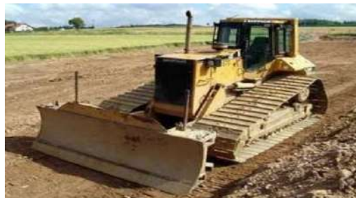
Gambar 5. Bulldozer

Bulldozer adalah jenis peralatan konstruksi bertipe traktor menggunakan track/rantai serta dilengkapi dengan pisau (dikenal dengan blade) yang terletak didepan.