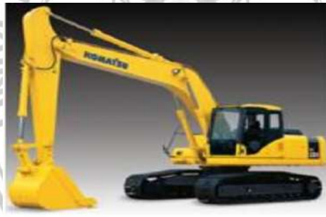
Gambar 1. excavator

Jenis alat ini dikenal juga dengan istilah excavator. Beberapa alat berat digunakan untuk menggali tanah dan batuan. Yang termasuk dalam kategori ini adalah front shovel , backhoe , dragline , dan clamshell .