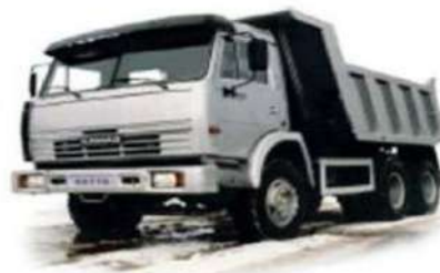
Gambar 2. dump truck

Untuk pengangkutan material lepas, (loose material) dengan jarak tempuh yang relative jauh, alat yang digunakan memerlukan alat lain yang membantu memuat material ke dalamnya.