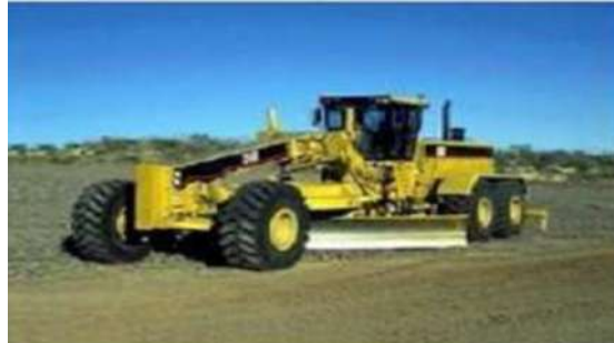
Gambar 3. motor grader

Berfungsi untuk meratakan pembukaan tanah secara mekanis, disamping itu grader dapat dipakai pula untuk keperluan lain misalnya untuk penggusuran tanah, pencampuran tanah, meratakan tanggul, pengurugan kembali galian tanah dan sebagainya.