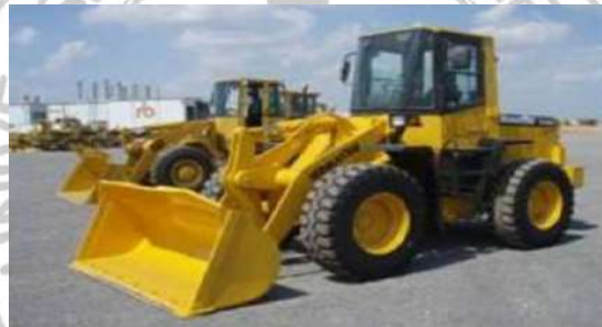
Gambar 4. wheel loader

Pada prinsipnya loader merupakan alat pembantu untuk mengangkat material dari tempat-tempat penimbunan ke alat pengangkut lain.