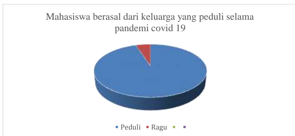
Gambar 4 Sikap Peduli dari Keluarga Mahasiswa

Adapun pertanyaannya, apakah keluarga Anda termasuk keluarga yang peduli sesama di masa pandemi covid19? 95% menjawab bahwa keluarganya juga merupakan keluarga yang mengajarkan pentingnya membantu sesama dan peduli terhadap sesama (gambar 4).