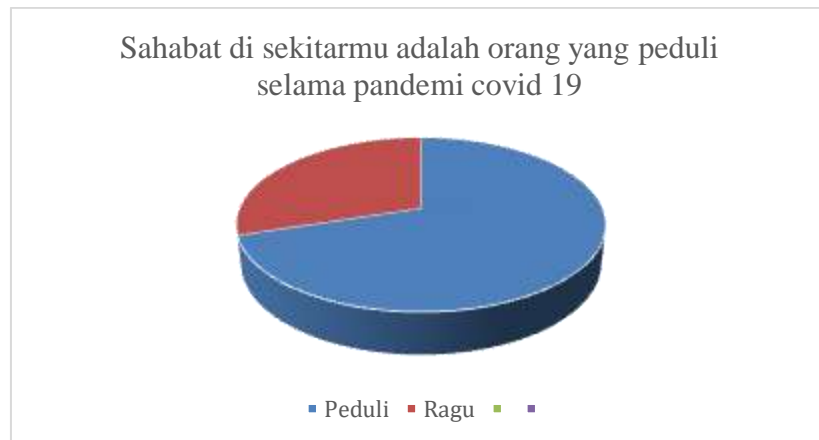
Gambar 3 Sikap Peduli Sahabat di Sekitarmu

adalah orang-orang yang peduli pada orang lain. Responden lainnya menjawab dengan ragu-ragu (gambar 3).