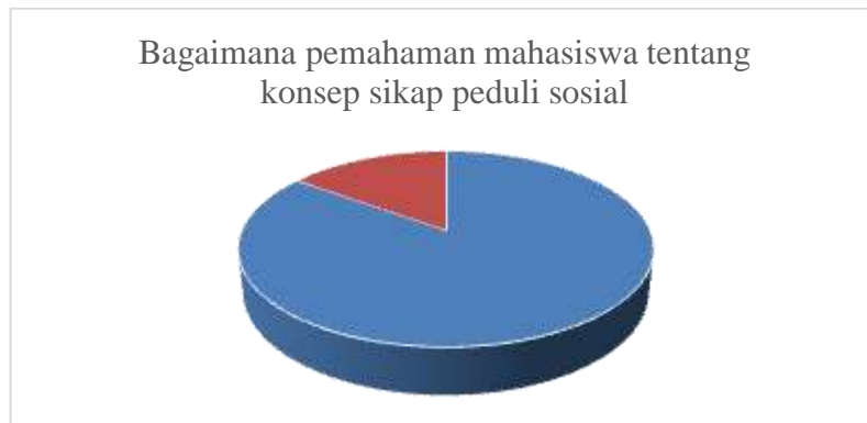
Gambar 1 Pemahaman Mahasiswa tentang Konsep Sikap Peduli Sosial

orang lain (85 %), sikap peduli sosial berarti mengindahkan, mengabaikan dan mengganggu (15%) seperti yang ditunjukkan pada Gambar 1.