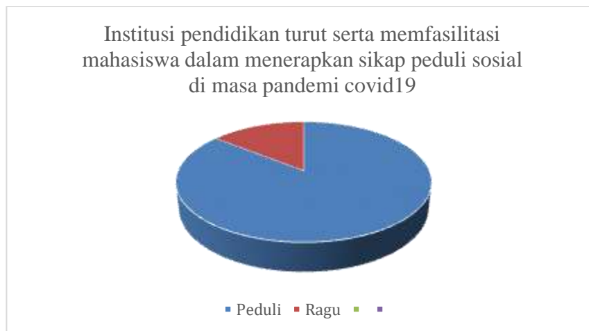
Gambar 5 Institusi Memfasilitasi Sikap Peduli Mahasiswa

85,7% mahasiswa menjawab bahwa sekolah (lembaga pendidikan) ikut memfasilitasi mahasiswa dalam menerapkan sikap peduli sosial selama pandemi covid19.