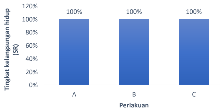
Gambar 3. Tingkat kelangsungan hidup (SR) kepiting bakau

kelangsungan hidup kepiting bakau ( Scylla serrata ) seperti disajikan pada Gambar 3 berikut: