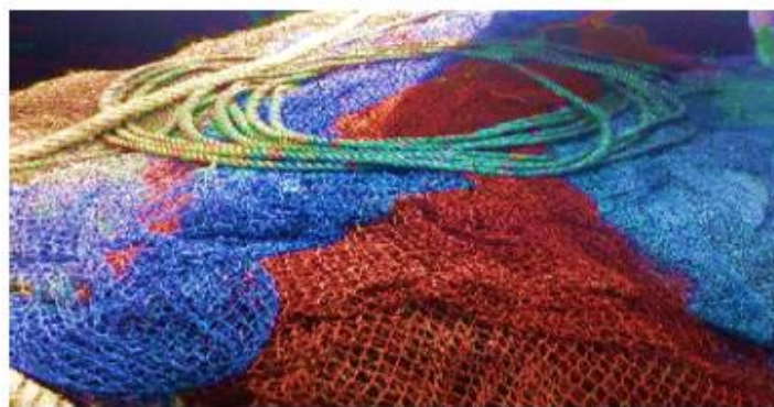
Gambar 2. Alat Tangkap Pukat Cincin

Alat tangkap yang digunakan merupakan alat tangkap pukat cincin berbentuk empat persegi memiliki panjang 500 meter, lebar 40,5 meter, ukuran mata linci, 2 inci, dan 4 inci. Ukuran dari tiap-tiap mata jaring secara berurutan terdiri dari 3 inci dengan panjang 500 meter, 2 inci dengan panjang 200 meter, 1,5 inci dengan panjang 100 meter serta 1 inci ukuran mata jaring 100 meter pada bagian kantong terlihat pada gambar 2.