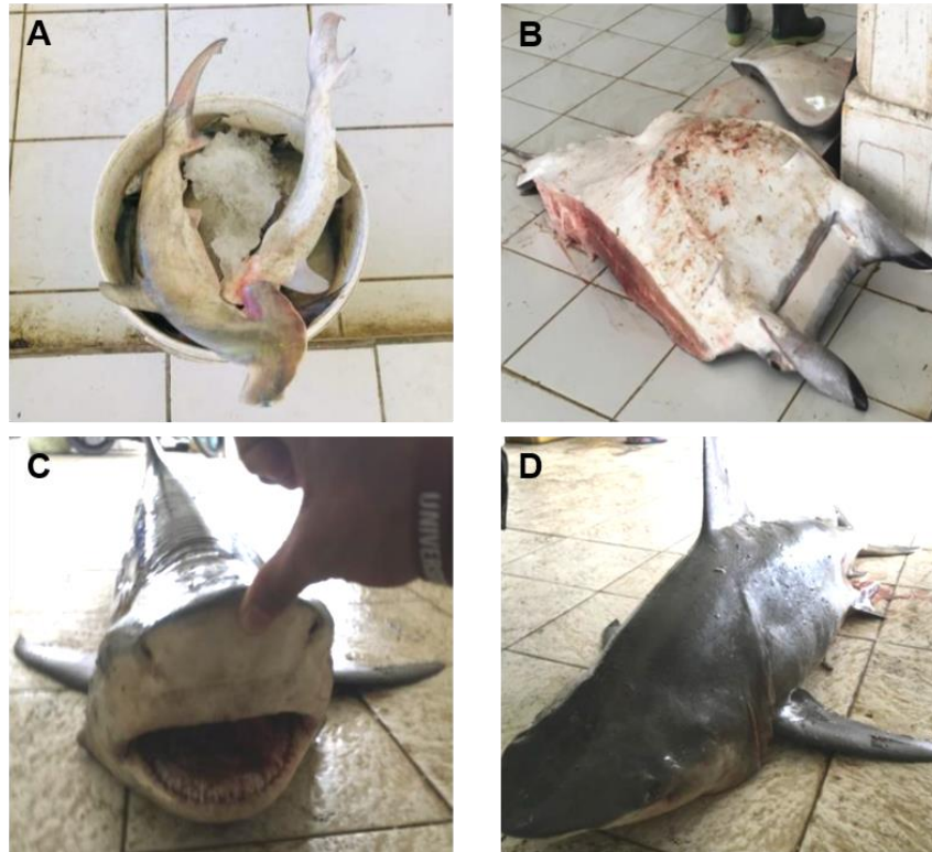
Gambar 2. Jenis Biota Laut dengan Status Konservasi Penting yang Ditemukan di TPI Kabupaten Pangandaran. Hiu Martil (A), Pari Mobula (B), Hiu Macan (C), Hiu Banteng (D)

Eksplorasi berlebihan terhadap sumber daya ikan hiu yang dilakukan selama beberapa dekade terakhir dapat menimbulkan efek bagi keseimbangan jejaring makanan di laut sehingga mempengaruhi kelimpahan spesies masing – masing tingkatan trofik. Salah satu dampak hilangnya apex predator dari lingkungan perairan adalah terjadinya trophic cascade yaitu terjadinya peningkatan kelimpahan populasi mangsa akibat menurunnya populasi predator (Bornatowski, 2014). Hal ini terjadi karena adanya direct effect , yaitu hilangnya predasi secara langsung, dan juga indirect effect seperti kompetisi. Dampak ekologis maupun biologis lain akibat hilangnya hiu sebagai apex predator secara luas masih belum banyak diketahui dan perlu dieksplorasi lebih lanjut (Navia et al. , 2010).