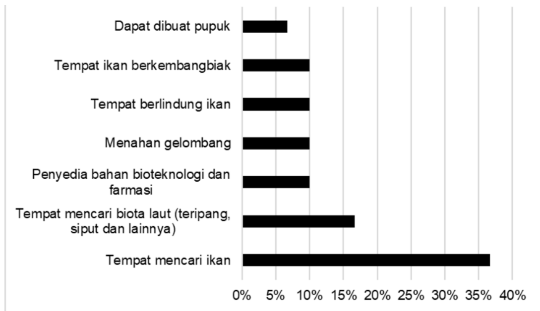
Gambar 2. Persepsi Masyarakat Pesisir Perairan Barat, Kabupaten Rote Ndao Terkait Jasa Ekosistem Lamun

kegiatan pengumpulan hewan invertebrata air yang dilakukan oleh wanita pesisir juga memberikan kontribusi penting bagi rumah tangga nelayan kecil. Berikut ini adalah rincian mengenai jasa ekosistem lamun yang dapat diberikan kepada masyarakat pesisir di Perairan Barat, Kabupaten Rote Ndao dapat dilihat pada Gambar 2.