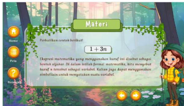
Gambar 2. Tampilan menu materi

Tampilan pada Gambar 1 menunjukkan menu utama aplikasi yang berisi navigasi ke berbagai fitur pembelajaran. Desain tampilan dibuat sederhana dan menarik agar mudah digunakan oleh siswa. Selanjutnya, media dilengkapi dengan tampilan materi yang menyajikan konsep bentuk aljabar secara sistematis disertai contoh soal. Tampilan tersebut disajikan pada Gambar 2.