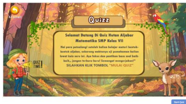
Gambar 3. Tampilan Menu Quiz

Berdasarkan Gambar 2, Penyajian materi disusun secara bertahap dengan menggabungkan teks dan elemen visual, sehingga memudahkan siswa memahami konsep abstrak. Media ini juga menyertakan fitur kuis interaktif untuk latihan dan evaluasi siswa. Tampilan kuisnya ditampilkan pada Gambar 3.