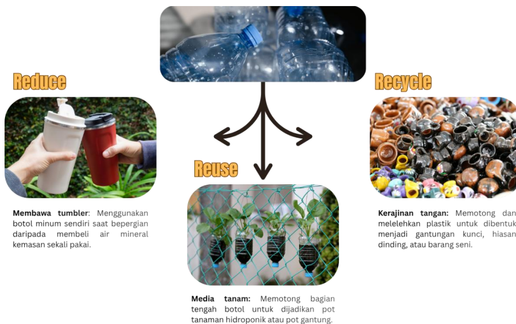
Gambar 4. Ilustrasi 3R ( Reduce, Reuse, Recycle )

Kesadaran dini akan bahaya pencemaran sampah penting untuk ditingkatkan dalam meminimalkan dampak dari pencemaran sampah dengan menerapkan gaya hidup yang sehat, membuang sampah pada tempatnya, serta berkontribusi dalam pengurangan sampah di lingkungan serta penerapan 3R ( Reduce, Reuse, Recycle ).