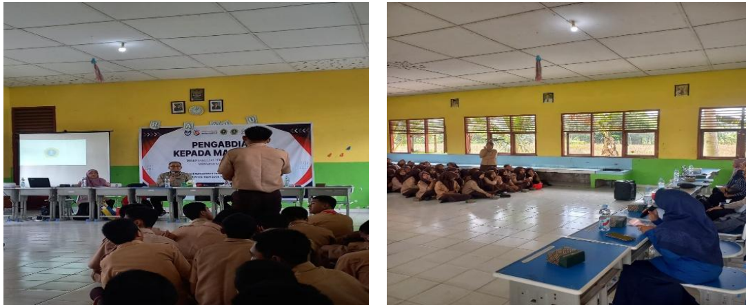
Gambar 3. Kegiatan tanya jawab siswa dengan pemateri

Peningkatan minat dan pemahaman peserta terlihat dari tingginya antusiasme siswa dalam mengajukan pertanyaan, memberikan tanggapan terhadap materi yang disampaikan, serta keterlibatan aktif mereka dalam mengikuti arahan pemateri selama sesi diskusi dan demonstrasi. Respons peserta menunjukkan bahwa materi yang diberikan tidak hanya menarik perhatian siswa, tetapi juga mampu meningkatkan pemahaman mereka terhadap isu pencemaran sampah di wilayah pesisir serta pentingnya peran generasi muda dalam menjaga kelestarian lingkungan. Kegiatan ini melibatkan 100 siswa SMA Negeri 1 Makarti Jaya, 1 orang dosen Program Studi Budidaya Ikan, 5 orang dosen Program Studi Ilmu Kelautan, serta 2 mahasiswa Universitas PGRI Palembang.