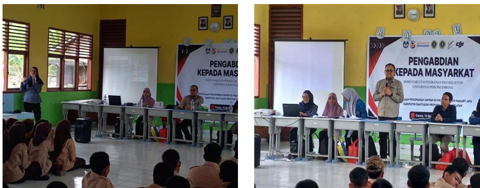
Gambar 2. Kegiatan penyampaian materi terkait Pencemaran Sampah di Wilayah pesisir

Materi kedua yang disampaikan adalah mengenai dampak pencemaran sampah terhadap ekosistem mangrove dan perikanan tradisional yang menekankan pentingnya menjaga keseimbangan ekosistem, mengingat peran mangrove sebagai habitat penting bagi biota laut dan sumber mata pencaharian masyarakat. Materi ketiga peserta diberikan pemahaman mengenai inovasi teknologi tepat guna dalam reduksi dan daur ulang sampah, yang mencakup pendekatan praktis seperti pemanfaatan kembali sampah plastik dan pengelolaan berbasis komunitas. Materi ini bertujuan untuk mendorong siswa agar tidak hanya memahami permasalahan, tetapi juga mampu berkontribusi dalam solusi yang aplikatif. Selain itu, disampaikan pula materi yang merekomendasikan model integratif pengelolaan sampah pesisir dengan menggabungkan aspek ekologi, ekonomi, dan sosial budaya.