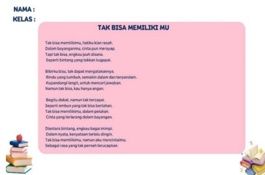
Gambar hasil pengerjaan proyek secara individu dari peserta didik kelas XI 10

untuk mengerjakannya karena dapat diakses melalui ponsel mereka. Diharapkan desain yang menarik ini akan meningkatkan semangat belajar siswa. Hasil proyek kelompok akan dipresentasikan pada pertemuan berikutnya. Untuk membuat mind map di Canva, pertama-tama buka situs web atau aplikasinya. Jika Anda belum memiliki akun, daftar atau log in. Setelah masuk, cari "Mind Map" di kotak pencarian dan pilih salah satu template yang tersedia di Canva. Ini akan membantu Anda membuat mind map dengan lebih mudah.