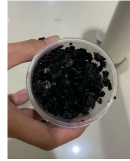
Gambar 9. Karbon Aktif