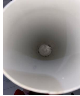
Gambar 8 Spun yang didalam pipa