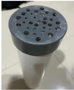
Gambar 2. Lubang Pada Pipa PVC

Tahapan pembuatan alat filtrasi dimulai dengan menutup salah satu ujung pipa PVC, kemudian membuat sejumlah lubang kecil berdiameter \pm 0,6 cm pada bagian dasar untuk jalur keluarnya air hasil penyaringan (Gambar 2). Sebuah botol plastik dipotong bagian atasnya sehingga berbentuk corong, kemudian ditempelkan pada dasar pipa PVC menggunakan selotip untuk memastikan sambungan kedap air (Gambar 3 dan Gambar 4).