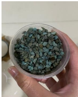
Gambar 10. Zeolit