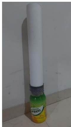
Gambar 5a Lapisan Filter Air dan 5b Produk Tech-Qua

Lapisan dasar terdiri atas tiga lapis kain poli nontenun yang berfungsi sebagai penyaring awal dan penahan media (Gambar 6). Lapisan berikutnya adalah spun 01, spun 03, dan spun 05, masing-masing berperan menyaring sedimen dengan ukuran berturut-turut lebih besar dari 1 mikrometer, 3 mikrometer, dan 5 mikrometer (Gambar 7 dan Gambar 8). Di atas lapisan spun ditempatkan kembali tiga lapis kain poli nontenun sebagai pembatas untuk menjaga stabilitas media. Lapisan penyaringan utama terdiri atas karbon aktif sebanyak dua setengah gelas ukuran 120 ml (Gambar 9), diikuti oleh zeolit sebanyak tiga hingga empat gelas, pasir silika empat gelas, dan kerikil kecil sebagai lapisan penutup yang menjaga agar pasir tidak terbawa aliran