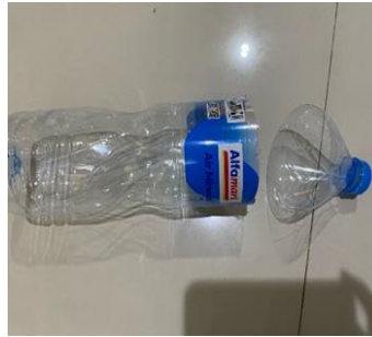
Gambar 3. Botol plastik yang ujungnya sudah dipotong