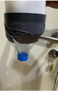
Gambar 4 Ujung botol direkatkan dengan pipa