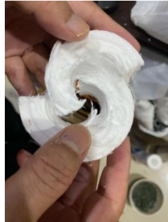
Gambar 7 Spun yang Sudah Dipotong