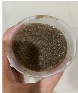
Gambar 11. Pasir silika