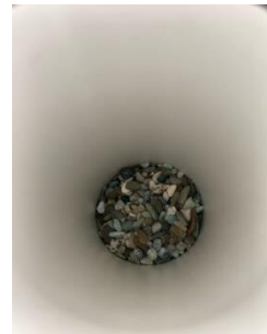
Gambar 12. Batu kerikil