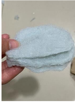
Gambar 6 Kain Penyaring yang Sudah Dicuci