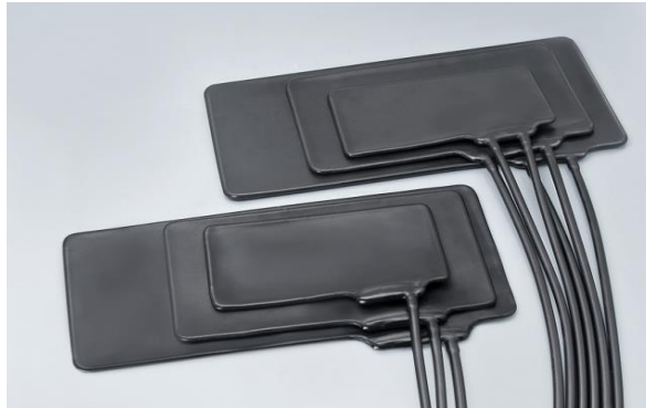
Gambar 1. Bladder

PT ABN adalah sebuah perusahaan yang memproduksi alat pengukur tekanan darah (tensimeter). Inspeksi 100% dilakukan terhadap salah satu komponen dari tensimeter, yaitu bagian bladder jenis natural. Bentuk bladder dan bagian-bagiannya ditampilkan pada gambar 1.