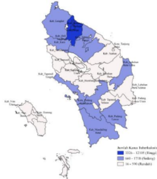
Gambar 1. Sebaran Kasus Tuberkulosis

Hasil penelitian dan pembahasan akan menguraikan hasil dari analisis yang telah dilakukan.