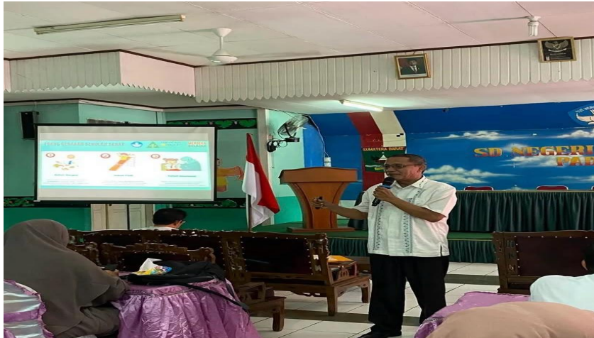
Gambar 5 : Kepala sekolah berdiskusi dengan guru mengenai strategi pembelajaran.

Hasil dokumentasi ini merupakan bukti bahwa 80% hasil wawancara yang mendukung pernyataan kepala sekolah mengenai perannya dalam meningkatkan mutu pendidikan di SDN 01 Ulak Karang Selatan. Dokumentasi ini mencakup berbagai aspek, seperti bimbingan dan evaluasi guru, pelatihan guru, pengelolaan sarana dan prasarana, serta kerja sama dengan pihak eksternal.