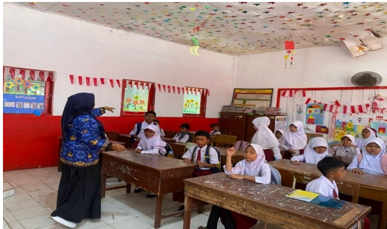
Gambar 8: Guru yang memberikan arahan kepada siswa sebelum mereka pulang sekolah