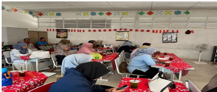
Gambar 4 : Guru-guru berdiskusi dalam sesi pelatihan yang dipimpin oleh kepala sekolah