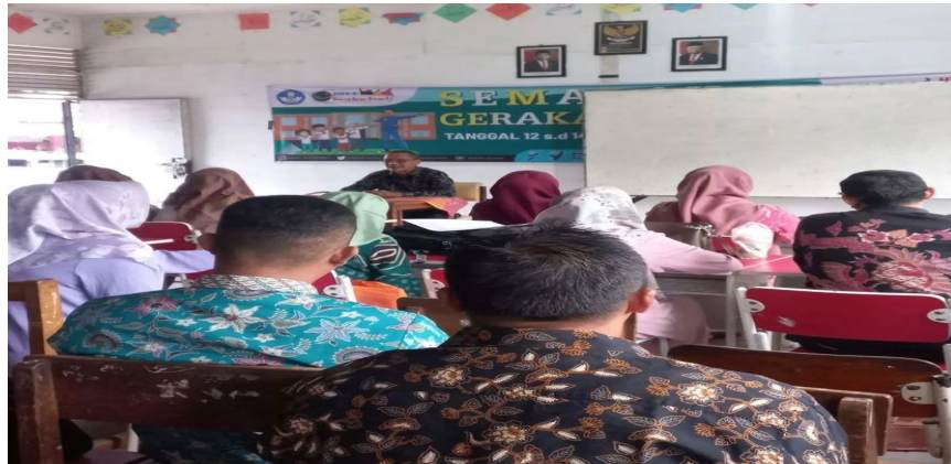
Gambar 3 : Kepala sekolah bersama guru dalam kegiatan pelatihan