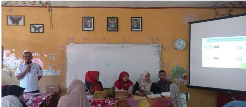
Gambar 2 : Guru-guru mengikuti arahan kepala sekolah dalam rapat evaluasi