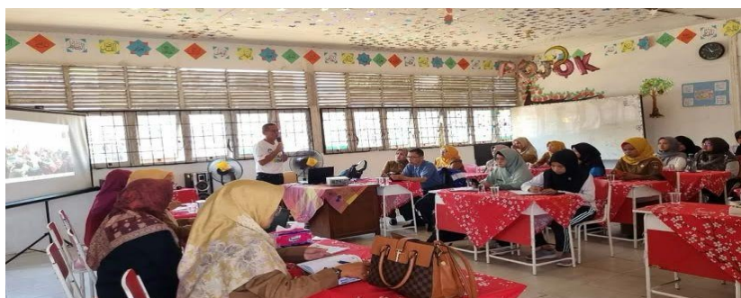
Gambar 1 : Kepala sekolah memberikan arahan kepada guru dalam sesi pembinaan