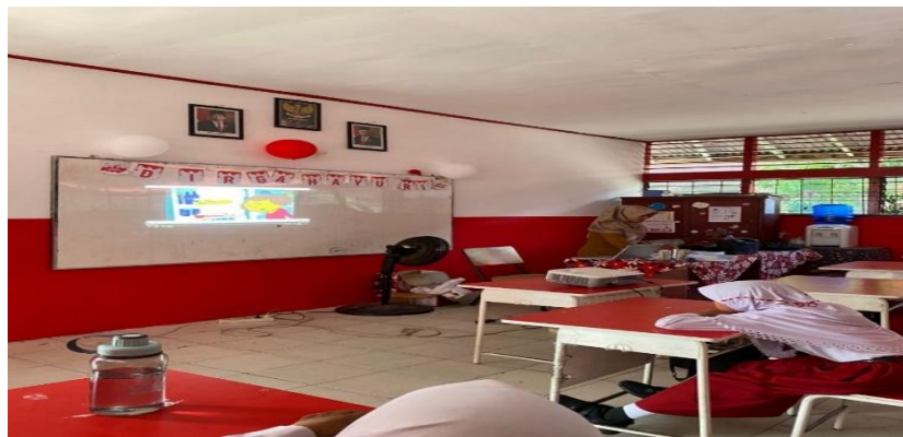
Gambar 9: Guru terlihat mengajar menggunakan infokus sebagai media pembelajaran