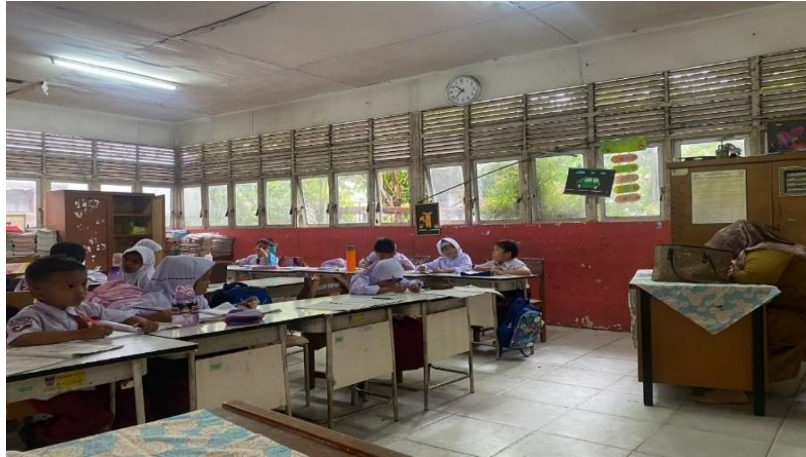
Gambar 7 : Suasana kelas yang kondusif dengan guru Fase A