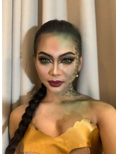
Gambar 2. Tata rias dan Busana Tokoh Naga dalam karya tari Abhimantra.

tari Abhimantra digunakan rias fantasi dan modifikasi busana yang bersumber dari tata busana tari gaya Surakarta dengan mengeksplorasi penambahan kain panjang hijau sebagai ekor dan kain poleng (hitam-putih). Penghadiran kain poleng sebagai bagian dari tata busana kedua tokoh, juga bermaksud untuk memunculkan bagian kecil dari identitas budaya Bali sebagai tempat pelaksanaan pementasan. Sementara tata rias pada karya Abhimantra adalah rias fantasi dimana make up yang digunakan make up cantik, tajam dan pada bagian wajah sebelah kanan ditambah lukisan sisik warna hijau berfungsi sebagai penegasan pada rias dan karakternya.