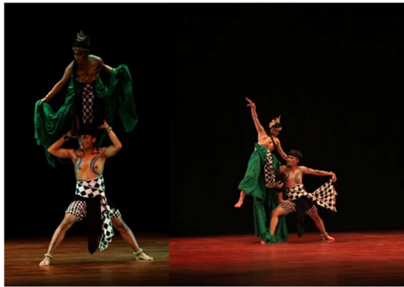
Gambar 1. Akrobatik pose bertingkat pada bagian peperangan Naga dan Bima dalam karya Abhimantra. (Sumber: Anton)

Setelah tokoh Bima dan Naga melakukan kontak pertemuan di tengah panggung, suasana berbalik menjadi tegang karena terjadi peperangan. Peperangan antara Naga dan Bima pada awalnya masih menunjukkan perang dengan gerak-gerak yang cepat, pengembangan dari idiom tari perangan gaya Surakarta. Gerak cepat ini dihadirkan untuk menunjukkan bahwa peperangan masih terjadi di permukaan air laut. Oleh karena itu masih digunakan gerak-gerak peralihan dengan lompatan-lompatan, akrobatik pose bertingkat dan perpindahan penari yang lebih dinamis.