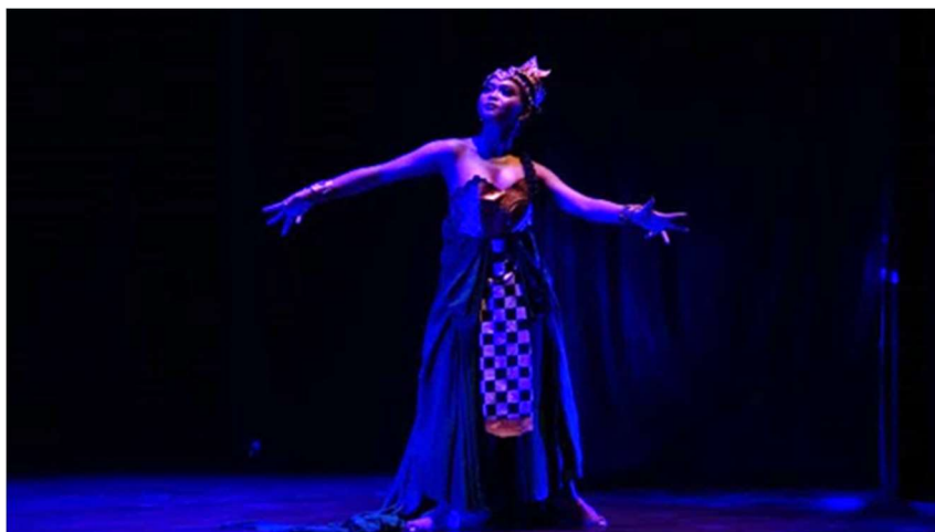
Gambar 3. Gerak gelombang tangan untuk gerak dasar karakter tokoh Naga Abhimantra.

Motif gerak dalam mencipta sebuah karya tari perlu digunakan sebagai dasar struktur untuk mendapatkan bentuk. Adapun motif Gerak gelombang laut menjadi gerak inti karya Abhimantra yang dianggap mampu mewakili garap suasana kisah Bima Suci dalam ruang situasi pertemuannya dengan Naga Penguasa Samudera. Pengorganisasian gerak gelombang laut yang dieksplorasi melalui ruang, waktu dan tenaga, serta divariasikan dengan gerak cepat, perlahan, dan mengalun. Proses dalam menciptakan sebuah komposisi tari dengan syarat-syarat pokok yang disatukan dengan aspek-aspek tari yaitu gerak, ruang dan waktu.