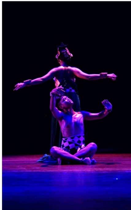
Gambar 4. Gerak gelombang yang dilakukan duet antara tokoh Naga dan Bima pada karya tari Abhimantra.

Motif gerak pada karya tari Abhimantra meliputi rangkaian motif gerak dasar ombak air dipermukaan laut yang berkarakter menggulung (volume besar, menengah, dan kecil), pergerakan air di dalam laut yang berat, pelan berayu, dan gerak arus air yang lurus. Gerak ombak yang digunakan pada karya tari Abhimantra seperti setengah badan atas meliputi tangan, badan, dan kepala bergerak mengalun atau melambai dengan tekanan tenaga. Gerak tubuh di kedalaman air adalah gerakan yang tegas, pelan dengan tekanan tenaga, dan bervolume besar. Gerak ini membentuk pose-pose tubuh yang tegas seperti kaki kuda-kuda menapak dasar laut, tangan dan tubuh menjulur membentuk garis lurus vertikal ke atas maupun ke bawah yang tegas, maupun gerak-gerak lompatan berputar pelan karena tekanan air.