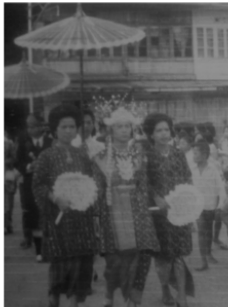
Gambar 2 Bagian pertama Midang Mabang Handak: Sepasang Pengantin

dibayangkan dan pasti akan pernah mengalami sulitnya kehidupan. Dengan mengelilingi ini juga dapat memperlihatkan kepada sepasang pengantin bahwa ada banyak tetangga di sekeliling kehidupan rumah tangganya. Artinya, dalam kehidupan rumah tangga harus saling mengerti, saling hormat-menghormati, saling gotong royong, dan saling tenggang-rasa dengan sesama tetangga dalam sebuah kebersamaan. Dari makna mengelilingi inilah dapat mengawali konsep kebersamaan pada kesenian Midang . Konsep kebersamaan yang ada pada kesenian Midang Mabang Handak ini juga tentunya beranjak dari semangat gotong-royong yang ada di dalam perkawinan Mabang Handak . Konsep kebersamaan ini dapat dilihat dari ketiga bagian Midang Mabang Handak . Ketiga bagian Midang Mabang Handak ini terdiri dari Bagian Pertama yaitu Sepasang Pengantin, Bagian kedua adalah Puluhan/ Ratusan Pasangan Muda-Mudi, dan Bagian ketiga adalah Tanjidor (Heryanto, 2015). Untuk lebih rincinya akan dijelaskan sebagai berikut;