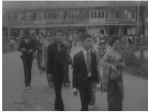
Gambar 3 Peserta Midang Mabang Handak (Koleksi Ibu Sundari)

Begitu juga kebersamaan pada bagian kedua Midang Mabang Handak dapat terlihat dari barisan pesertanya. Peserta Midang ini merupakan puluhan maupun ratusan bujang dan gadis yang berasal dari kerabat sepasang pengantin, baik dari keluarga bengian (mempelai laki-laki) maupun dari pihak keluarga maju (mempelai perempuan). Peserta Midang ini berbaris secara berpasang-pasangan mengiringi kedua mempelai mengelilingi Kayuagung dengan berjalan kaki \pm sejauh lima km.