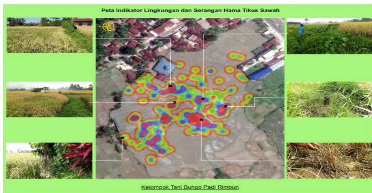
Gambar 3. Peta indikator lingkungan dan ekosistem hama Tikus Sawah

Dari peta dapat disimpulkan bahwa pengaruh ekosistem disekitar sawah sangat berpengaruh seperti, irigas dan pematang. Sawah yang paling tinggi tingkat kerusakannya adalah Sawah yang berada didekat irigasi kotor serta pematang yang penuh ditumbuhi rerumputan. Dari indikator tersebut dapat dilihat fisiologis tikus yang menyenangi daerah tertutup serta kotor sehingga tikus sawah membuat sarang disekitar pematang dan irigasi yang kotor. Peta indikator lingkungan dan serangan hama tikus sawah dapat dilihat pada gambar 3.